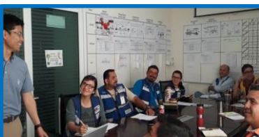
SDCAの説明 (現場リーダー)