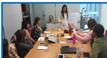
標準化ドリル (営業チーム)