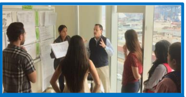
問題解決 (人事マネジャー)