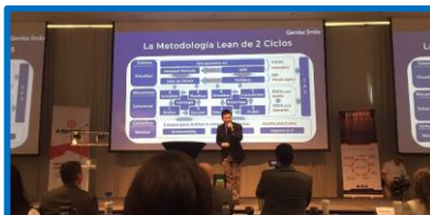
リーン・マネジメントセミナー