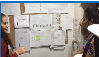
カイゼン説明 (安全部門)