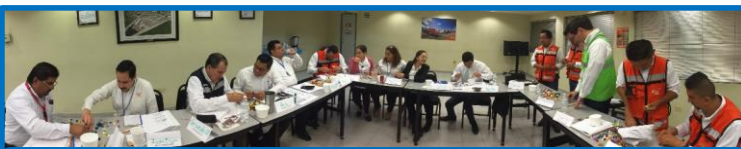
座学 ~ 5Sと7つのムダ (現場リーダー)